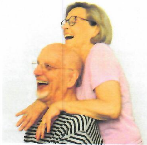
Abb. 4: Freude am Sein und am Tun

► Inhalte des Senioren-Programms: Mit diesem Programm wird älteren Menschen ein leicht erlernbarer und gegenseitig durchführbarer Behandlungsablauf vermittelt, der dem Shiatsu entstammt und durch Meridian-Aktivierungsübungen ergänzt wird.