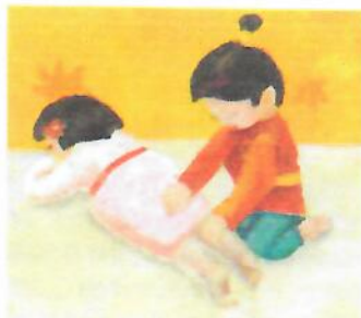
Abb. 8–10: „Katzenpfoten zum Schnurren“ (Kalbantner-Wernicke & Wernicke 2015) im Kindergarten

Wo soll ich nun weiter drücken? Bin doch fertig mit dem Rücken! Ach – da sind ja deine Beine, dicker als 'ne Hundeleine!