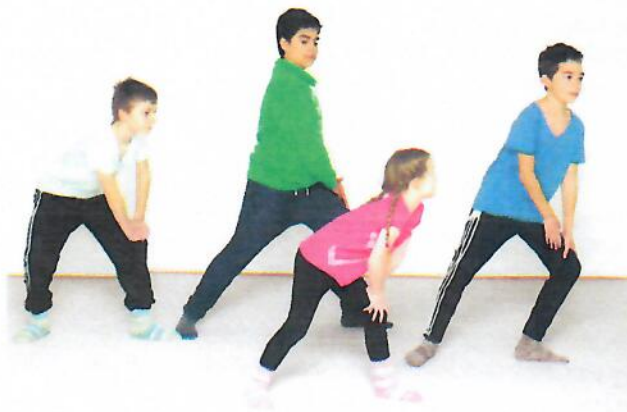
Abb. 2: Bewegung macht Spaß – Stark, mutig und selbstbewusst

Schülerinnen, ein Bewegungsprogramm zu praktizieren, das auf dem energetischen Entwicklungskonzept (Kalbantner-Wernicke & Wernicke 2017b) und der Meridianlehre basiert (Abb. 2).