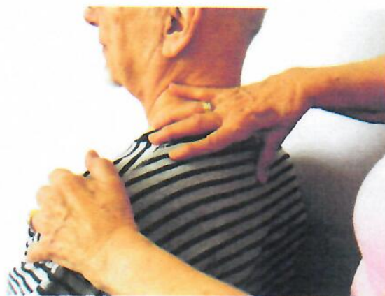
Abb. 15: Flügel putzen

„Ihre Hand fixiert die Schulter ... Mit der einen Hand umgreifen Sie großflächig von vorne den Schulterbereich. Ihre andere Hand liegt wirbelsäulennah, dabei spreizen Sie den Daumen so ab, dass er am Schulterblattrand liegt ... Während Sie mit der vorderen Hand die Schulter nach hinten bewegen, bleibt der Daumen am Schulterblattrand an seiner Stelle. Auf diese Weise schieben Sie das Schulterblatt über den Daumen – das wäre zumindest das Ziel. Doch oft ist dieser Bereich so verspannt, dass das nicht möglich ist. Achten Sie darauf, dass Sie die Bewegung nur so weit ausführen, wie sie für Sie beide angenehm ist ... Nun darf der Daumen etwas weiter nach unten wandern und Sie wiederholen den Ablauf.“