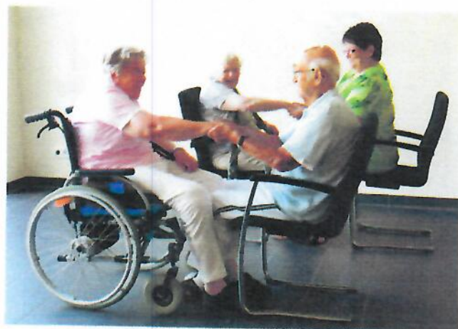
Abb. 5: Gegenseitige Handbehandlung

Was das Samurai-Programm beim Einsatz in Senioreneinrichtungen besonders wertvoll macht, ist die Förderung des zwischenmenschlichen Kontakts durch achtsame Berührung zwischen den Heimbewohnern untereinander bzw. zwischen Betreuer und Heimbewohner. Als Konsequenz zeigt sich ein verändertes aktives Sozialverhalten, was daran erkennbar ist, dass die Heimbewohner mit Freude Partner- und Gruppenübungen durchführen und dabei erfahrene Wertschätzung, Selbstvertrauen, Zuversicht und Humor miteinander austauschen (Abb. 5).