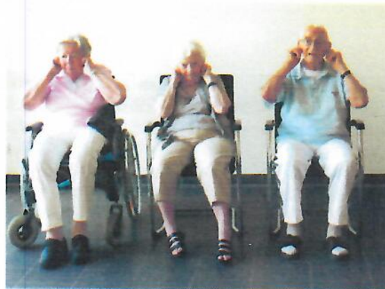
Abb. 16: Ohren spitzen

Wirkung: Beweglichkeit von Schultern und Schulterblättern haben einen positiven Einfluss auf die Atmung und eine große Bedeutung für die Körperaufrichtung. In Japan gibt es das Beschwerdebild der sog. „50-Jahre-Schulter“. Das bedeutet: Lassen die Schultern in ihrer Beweglichkeit nach, spricht dies dafür, dass man alt wird. Das beste Mittel dagegen – die Schultern beweglich halten.