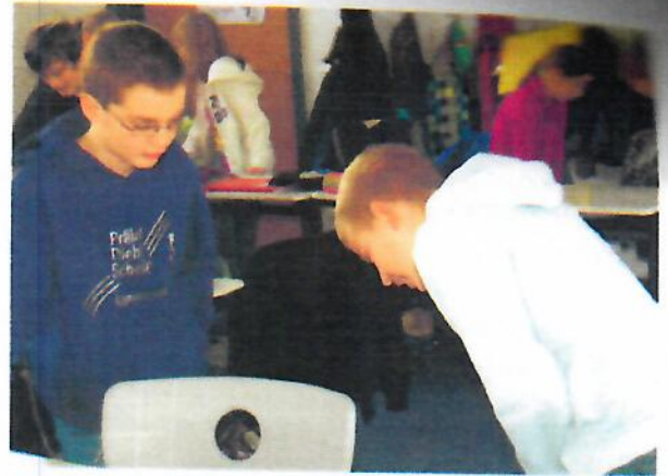
Abb. 3: Sich Bedanken vor und nach einer Behandlung

Praktisch umgesetzt wird dieses Einüben, indem als erstes mit der Begrüßung auf Japanisch begonnen