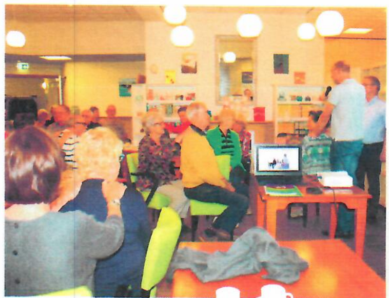
Abb. 6–7: Impressionen von Seniorengruppen aus den Niederlanden

Der rege Zuspruch und die zahlreichen Anfragen zeigen, dass hier ein großer Fortbildungsbedarf besteht.