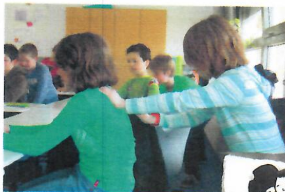
Abb. 13–14: „Samurai, Bär und Tiger treffen sich“ (Kalbantner-Wernicke & Wernicke 2017a) in der Schule

Es folgt „Samurai, Bär und Tiger treffen sich“. Dabei wandern die Hände des behandelnden Kindes wie kräftige Bärenpatzen beidseits der Wirbelsäule (Blasenmeridian) von oben nach unten (Abb. 13–14). Von unten nach oben schleichen die Hände wie Tigerpfoten auf der Wirbelsäule (Du Mai).