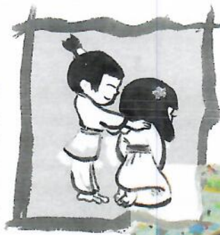
Abb. 11–12: „Samurai wärmt sich in der Sonne“ (Kalbantner-Wernicke & Wernicke 2017a) in der Schule

► Beispiel aus einer Behandlungssequenz: Das Kind, das behandelt wird, sitzt auf dem Stuhl, das andere steht hinter ihm. Mit der Frage: „Darf ich dich anfassen?“